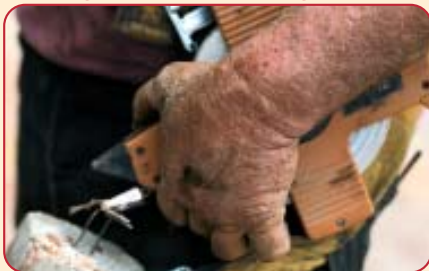
Voll daneben: Dieser Arbeiter hat seinen Hautschutz sträflich vernachlässigt.

Problematisch wird die Sache dann, wenn aufgrund mangelnden Schutzes oder schlechter Pflege die Haut ganz allmählich trocken, spröde und rissig wird. Sie verliert dann Schritt für Schritt ihre natürliche Schutzfunktion und Schadstoffe können schneller und vor allem tiefer eindringen. Die Folge sind Hauterkrankungen, die sich zum Beispiel durch juckende, gerötete Hautstellen, Schwellungen, Bläschenbildung und