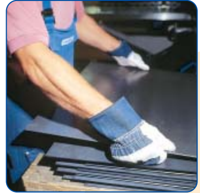
Schutz für die Hände: Schutzhandschuhe schützen auch vor mechanischen Belastungen und Schnittverletzungen.

Wichtig: Bei Arbeiten an rotierenden Werkstücken oder Werkzeugen (Dreh-, Bohr- und Fräsmaschinen) dürfen auf gar keinen Fall Schutzhandschuhe getragen werden. Hier besteht nämlich die Gefahr, dass der Handschuh von der Maschine oder dem Werkstück erfasst wird.