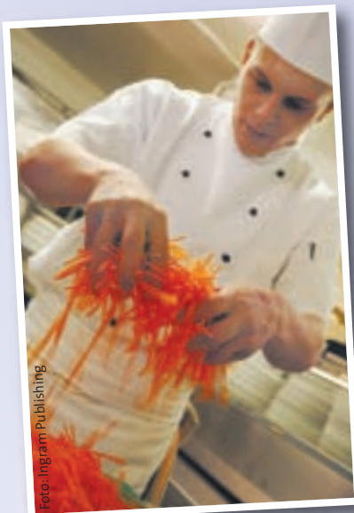
Feine Sache: Die Beiträge für die gesetzliche Unfallversicherung tragen ausschließlich die Arbeitgeber.

Zunächst sollte er klären, ob überhaupt ein Verstoß vorliegt. Experten für diese Fragen sind Fachkräfte für Arbeitssicherheit oder Sicherheitsbeauftragte. Auszubildende sollten sich außerdem Unterstützung bei erfahrenen Kollegen holen, zu denen sie Vertrauen haben. Durch ein ruhiges und diplomatisches Gespräch mit dem Chef und mit Kollegen, die einem den Rücken stärken, erreicht man am meisten.