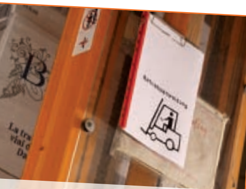
Am besten immer vor Augen: die Betriebsanweisung.