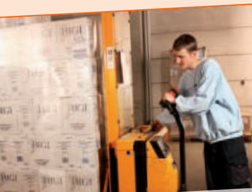
Beim Rangieren sollte man sich niemals zwischen Deichselkopf und Antriebsrad stellen. Sonst fährt man sich schon mal selbst über den Fuß.

Regal hoch- und runterzufahren. So etwas ist nicht mutig, sondern einfach nur leichtsinnig und dumm. Und der Fahrer sollte wissen, dass er sich im Falle eines Unfalls strafbar machen kann. Je nach Ausgang ist das fahrlässige Körperverletzung oder sogar fahrlässige Tötung.