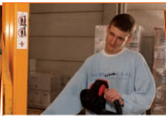
Alles in Ordnung? Die tägliche Sicht- und Funktionsprüfung des Fahrzeugs hilft, Mängel früh zu erkennen.