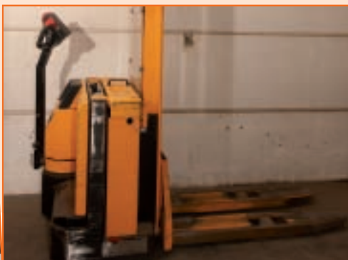
Feierabend: Gabel ganz runter, Schlüssel abziehen und dafür sorgen, dass der Hubwagen nicht im Weg steht.