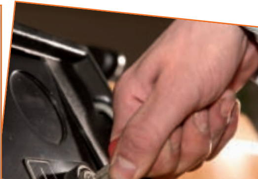
Auch bei kurzen Pausen: immer Schlüssel abziehen.