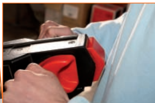
Clever: Der Pralltaster im Deichselkopf verhindert, dass der Mitgänger zwischen einem Hindernis und dem Deichselkopf eingeklemmt wird.

Da geht es den Ameisen und Schildkröten wie den größeren Gabelstaplern: Zunächst werden sie dort hingefahren, wo sie niemanden stören und kein Verkehrshindernis darstellen. Deshalb darf man sie auch nie vor Notausgängen oder Rettungswegen abstellen. Dann werden die Gabeln vollständig abgesenkt, damit niemand darüber stolpert, alle Bedienelemente werden auf „AUS“ gestellt. Schlüssel abziehen nicht vergessen – das macht man auch, wenn man während der Arbeit das Fahrzeug verlässt. Damit niemand Unbefugtes noch mal schnell eine Runde dreht.