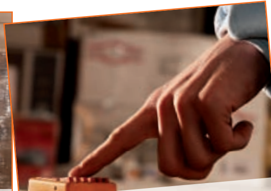
Funktionstest: Ist der Not-Aus-Schalter in Ordnung?